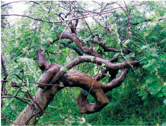
Фото 14. Sorbus aucuparia (рябина перистолистная). Этой рябине специально, в течение многих лет, садовник придавал причудливую форму. Москва, ВВЦ.

орхидей дождевого леса, и с полным правом считаются самыми совершенными существами растительного царства.