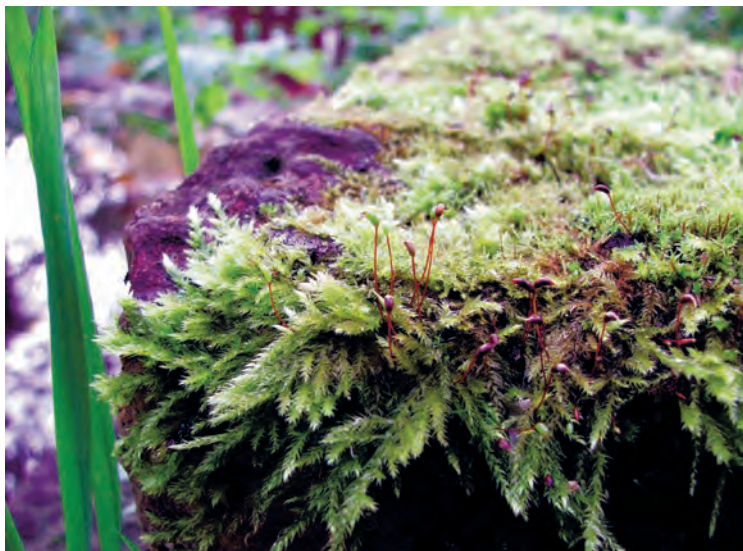
Фото 5. Листостебельный мох из семейства бриевых. Спорангий на тонкой ножке – спорогоне, по существу, и есть спорофит. Ветвящийся же «стебель» с зелёными «листьями» – гаметофит. Подмосковье.

вестно. До сих пор учёные спорят о преимуществах, которые получают в процессе эволюции спорофиты растений или их гаметофиты. Аргументация сторонников обеих точек зрения очень серьёзна и, безусловно, заслуживает внимания. Так, считается, что гаметофиты, обладающие лишь половинным набором хромосом, не способны к «революционной» изменчивости и представляют собой тупиковый путь эволюции. Другие же учёные считают гаметофиты с их упрощённым набором хромосом предвестниками будущего разнообразия растений. Не будем спорить по этому поводу ни с теми, ни с другими. Лишь отметим, что хотя мхи, судя по всему, устроены проще других высших растений и очень напоминают некоторыми чертами строения псилофиты, но в ископаемом виде появляются немного позже, чем, например, плауновидные. Как говорится, природа полна тайн.