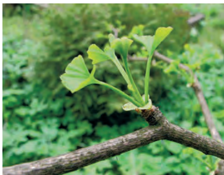
Фото 12. Ginkgo biloba . Побег с молодыми листьями.

одна. В том, что она развивается в женский гаметофит на материнском растении под защитой специальной оболочки, а не выбрасывается в одноклеточном состоянии на волю ветрам и непогоде. В том, что и оплодотворение, и дальнейшее развитие зародыша тоже происходит без отрыва от «матери». И на почву попадает уже готовый к прорастанию организм. Правда, у наиболее древних и примитивно устроенных голосеменных, например, у того же Ginkgo biloba , семя может опасть на землю и до оплодотворения. Тогда оплодотворение и развитие зародыша происходит уже на земле. В этом случае говорят, что на растении развивается не семя, а семязачаток, и в семя он превращается позже.