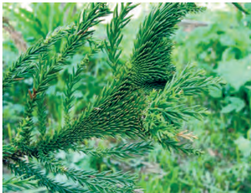
Фото 9. Cryptomeria japonica « crinata » (криптомерия японская «гребенчатая».) Видны побеги, сросшиеся в уплощённый листо- подобный орган. Подмосковье.

из целого класса гинкговых. Для сравнения, представьте себе, что из всего класса птиц остался лишь волнистый попугайчик! Что поделаешь, sic transit gloria mundi... Саговниковые, особенно в литературе о комнатных растениях, часто называют пальмами, что, несмотря на их внешнее сходство, неправильно. Ведь пальмы — растения цветковые. Среди современных голосеменных можно упомянуть ещё класс гнетовых, среди которых — очень необычные эфедровые, больше похожие своими членистыми стеблями на хвощи, и совершенно фантастического облика вельвичиевые, напоминающие низкий толстый пенёк с