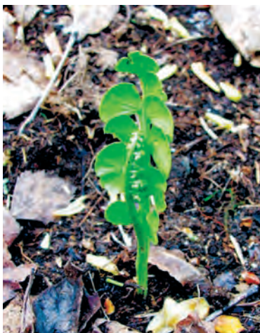
Фото 1. Botrychium lunaria (гроздовник полулунный).

Число видов высших растений огромно — на данный момент насчитывается около 300 тысяч, а многие ботаники оценивают их количество в 500 тысяч. Даже сейчас, когда может показаться, что все растения уже открыты, примерно каждую неделю учёные описывают один новый вид. А относительно недавно, в 1994 году, в Австралии, в каких-то 150 километрах от Сиднея была обнаружена группа хвойных деревьев (не больше ста экземпляров) неизвестного ранее рода! Надо сказать, что родов ныне живущих хвойных всего-то осталось чуть больше шестидесяти и, казалось бы, все они известны. Но факт есть факт. Не в непроходимых джунглях, а в пригороде столицы росли деревья неописан-