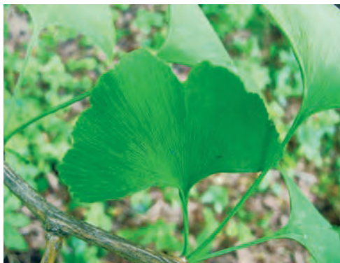
Фото 11. Лист Ginkgo biloba (гинкго двулопастной). Подмоскowie.

и мужские — помельче, за что их назвали микро-спорами. Так же как и у споровых, у семенных растений из споры развивается заросток. Из мега-споры — женский, из микроспоры — мужской. Так в чём же отличие семенных растений от споровых в таком случае? А в том, что у семенных растений женская спора осталась в спорангии