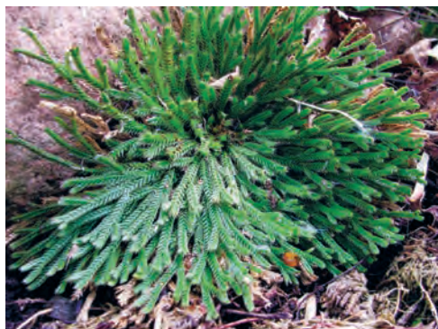
Фото 7. Selaginella involvens (селагинелла завёртывающаяся). Подмосковье.

Теперь поговорим о растениях, которые распространяются семенами. Как мы уже выяснили, они представлены всего двумя отде-