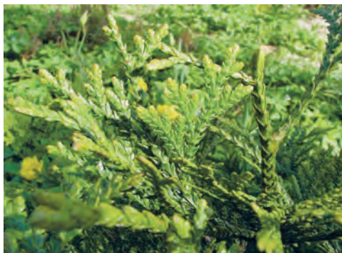
Фото 8. Класс хвойные. Thujaopsis dolabrata (туёвик долотовидный). Подмосковье.

Какие же растения относятся к голосеменным? Из современных — это хорошо известные нам классы хвойных (фото 8 и 9), саговниковых (или цикадовых) (фото 10), а так же гинкго билоба (фото 11 и 12) — единственный сохранившийся до наших дней вид