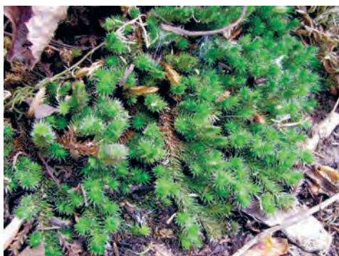
Фото 6. Отдел плауновидные. Selaginella sibirica (селагинелла сибирская). Подмосковье.

мелкими «листочками» побегов плауна. Но одну важную деталь надо отметить обязательно. Дело в том, что споровые растения бывают равно- и разноспоровыми. У разноспоровых и споры, и заростки разные. А именно — мужские и женские. Из женской споры развивается женский гаметофит, а из мужской споры — мужской гаметофит.