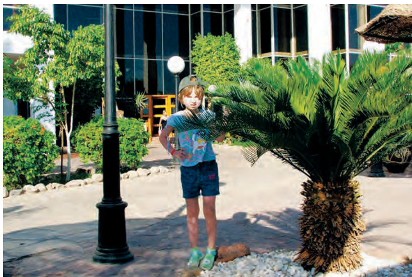
Фото 10. Cycas revoluta (саговник поникающий).

Ствол покрыт бурым чехлом из остатков черешков отмерших листьев. В природе старые листья обвисают, образуя нечто вроде неаккуратной «юбки», чем и объясняется видовой эпитет этого растения.