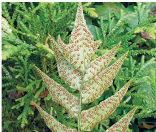
Фото 3. Спороносный лист Cyrtomium fortunei (циртомиума Форчуна). Видны круглые сорусы. Подмосковье.

и они хорошо различимы даже на ещё не полностью развернувшихся листьях (фото 2). Сначала сорусы зелёные, потом, когда споры созреют, приобретают бурую, ржавую окраску (фото 3, 4). После созревания спор спорангии открываются, лопаются вдоль специальной щели, и споры разносятся ветром. Переноситься они могут очень далеко, даже через океан.