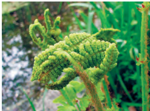
Фото 2. Osmunda claytoniana (чистоуст Клайтона).

Давайте проследим процесс размножения споровых растений на примере некоторых папоротников. Все мы видели самый обычный папоротник средней полосы — Dryopteris или, по-русски, щитовник. На нижней стороне его листа можно заметить многочисленные спороносные зоны, которые порой называют спорами. Это не совсем