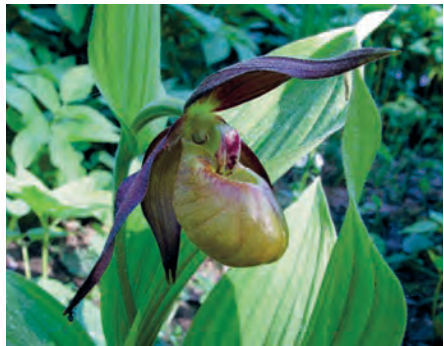
Фото 15. Cypripedium ventricosum (башмачок вздутый). Подмосковье.

Вопрос этот касается правил, по которым растениям, да и вообще всем живым существам, даются названия. Эти правила называются правилами номенклатуры. Они весьма многочисленны и, к тому же, не всегда соблюдаются. Поэтому мы не будем обсуждать их тут очень уж подробно, но с основными законами придётся разобраться.