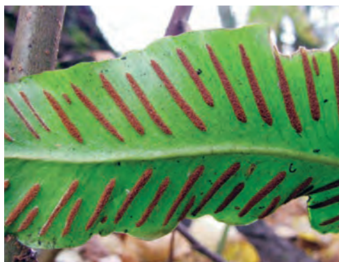
Фото 4. Часть спороносного листа Phyllitis scolopendrium (Листовика обыкновенного). Хорошо видны длинные линейные сорусы. Подмосковье.

Но вот спора попала на подходящий для прорастания влажный участок почвы. Вы думаете, что из неё сразу вырастет новый папоротник с резными листьями? Ничего подобного. Сначала из упавшей на землю споры вырастает заросток (учёные называют его гаметофитом, то есть «растением с половыми клетками»). Потом на заростке разовьются половые органы. В них образуются мужские и женские половые клетки — сперматозоиды и яйцеклетки. Затем,