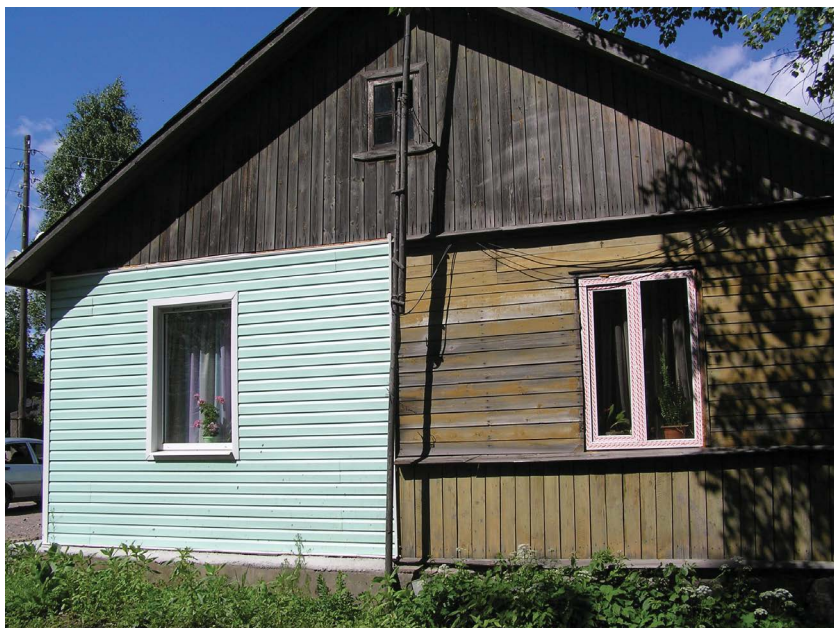
Рис. 1.1. Контраст двух разных видов одного дома – в процессе работы

Это справедливо для внешних стен дома. Но что прикажете сделать в первых (с улицы) помещениях, то есть прихожей вплоть до гостиной, – так ведь тоже надо создать уют, в продолжение хорошего впечатления, которое сложилось еще за порогом.