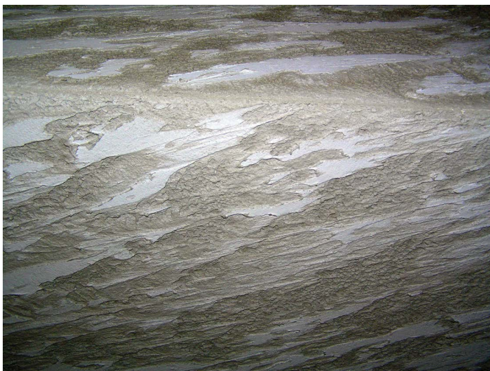
Рис. 1.2. Работа шпателем для образования «рваных краев»

На выровненные стены наложили цементный раствор, который наискось шпателем «срезали», образовав «рваные края». Этот шаг иллюстрирует рис. 1.2.