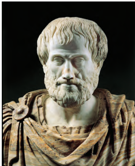
Рис. 1.3 ❖ Аристотель

Первую попытку формализации мышления следует признать за Аристотелем. Конечно, вряд ли древний грек формулировал задачу построения искусственного интеллекта. В античности такая задача не являлась актуальной хотя бы потому, что для древних Земля была населена массой различных мыслящих существ. Современное желание разобраться в вопросе разума, как мне кажется, произошло от осознания уникальности человеческого мышления. И логику силлогизмов, созданную Аристотелем, следует признать попыткой математически точного описания мыслительных процессов. И попыткой, достаточно успешной для того времени.