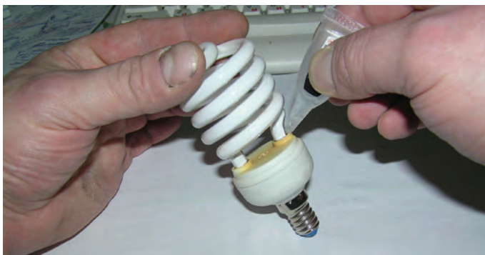
Рис. 1.2. Энергосберегающая лампа с цоколем E14

На рис. 1.2 представлен вид на энергосберегающую лампу с цоколем E14.