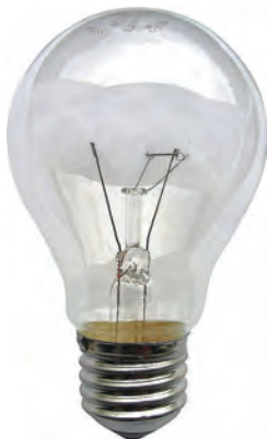
Рис. 1.1. Вид классической лампы накаливания

На рис. 1.1 представлена такая «классическая» лампа.