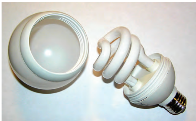
Рис. 1.3. Колба лампы в форме шара с тремя люминесцентными трубками внутри

Иногда в магазинах можно увидеть лампы в форме непрозрачного шара, см. рис. 1.3.