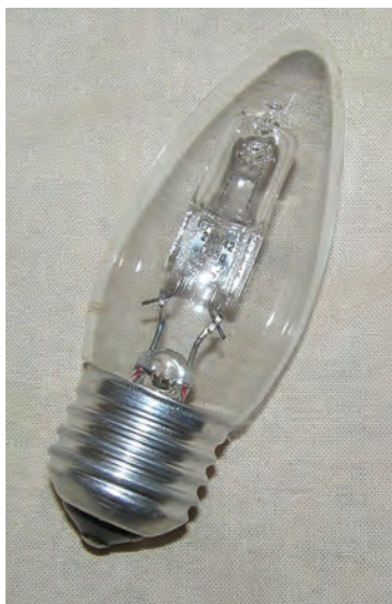
Рис. 1.5. Вид на ксеноновую лампу с цоколем E27

Есть еще один тип ламп – ксеноновые, или галогеновые. По конструкции ксеноновые лампы представляют собой колбу шаровой, эллипсоидной или трубчатой формы. К примеру, ДКсЭл 250-3, ДКсЭл 500-6, ДКсЭл 1000-6, ДКсЭл 2000-6, ДКсЭл 3000-6 и др. На рис. 1.5 представлен внешний вид ксеноновой лампы.